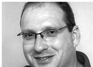
Von unserem Mitarbeiter Christian Ortner

Man kann durchaus unterschiedlicher Meinung sein. Man kann auch zu Sachfragen einen anderen Zugang haben, andere Prioritäten setzen, anderer Wählerklientel verpflichtet sein. Aber man darf dabei nicht vergessen, dass bei allen Meinungsverschiedenheiten immer das Beste für Parndorf und seine Entwicklung das Ziel sein muss. Davon sollte die politische Arbeit aller Fraktionen bestimmt sein.